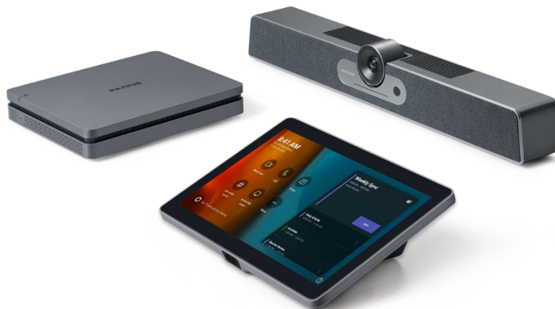
Image : Kit XT10-VB