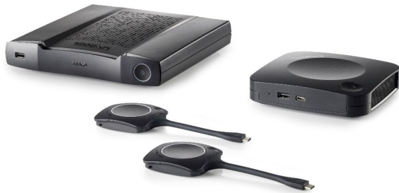
RS-232. Système de conférence ClickShare de Barco

Les systèmes de conférence et de présentation sans fil, tels que le système de conférence ClickShare de BARCO (CX-20, CX-30 and CX-50) , offrent un moyen simple d'améliorer les environnements de réunion, de collaboration et d'apprentissage des participants. Les utilisateurs peuvent facilement brancher leurs appareils au système sans se casser la tête, ce qui rend le BYOD plus facile. Par contre, pour basculer le système vers le système de vidéoconférence pour ordinateur portable, vous avez besoin du TOGGLE. Il transférera tous les dispositifs USB vers l'ordinateur portable via le ClickShare de Barco. Pour se faire, il vous suffit d'utiliser le commutateur à bouton-poussoir directement sur le TOGGLE ou de cliquer sur le système PAD puisque le TOGGLE est contrôlable par